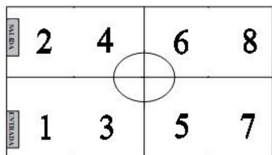
GRUPO A (a partir de marzo)